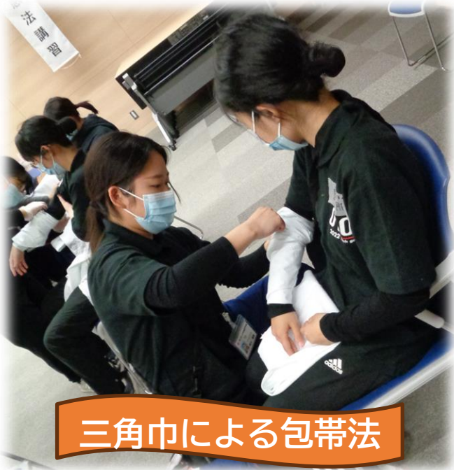
三角巾による包帯法