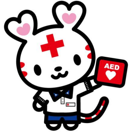
総合演習振り返り