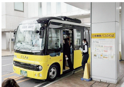
南館バス停停車中のフラット

最近、岡山市内のあちこちで見かけるようになった小型の黄色い新しいバス「FLAt」が令和8年4月1日より、当院の南館玄関前バス停(バス停名称：日赤病院)に乗り入れております。岡山市