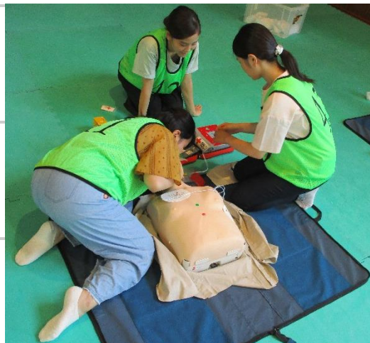
競技開始前、真剣に練習をしています。

18チームが出場し、その中で、我が岡山赤十字看護専門学校からも、2・3年生混合チームが出場しました。