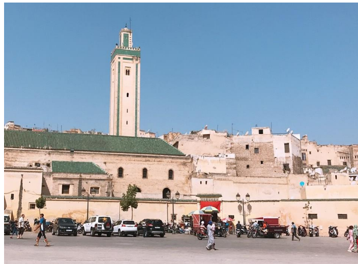
モスクが見える広場にて inフェズ

モロッコはイスラム教国家です。 「写真を撮られると魂が抜かれる」など日本の生活では遭遇し ない考え方がたくさんあります。 知識として知っていても実際に触れ合ってみるとその考え方が モロッコの人たちの生活, 習慣, 文化にどれだけ影響している か分かりました。 (Bさん、Cさん)