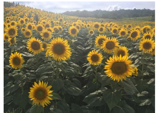
福島県三ノ倉高原のひまわり畑