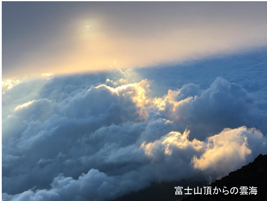
富士山頂からの雲海

もちろん、自己学習で看護の土台になる解剖生理学の復習も行いました。これからの学習に結び付けていきたいと思います。(Dさん)