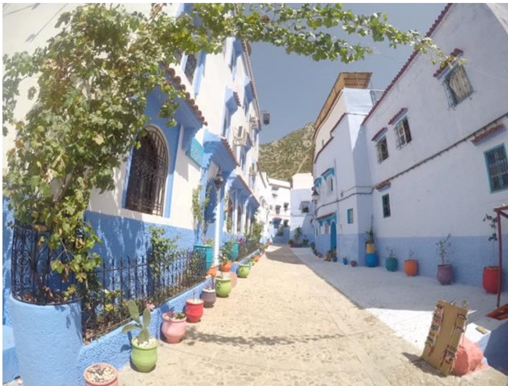
話題の青の街の真ん中で inシャウエン